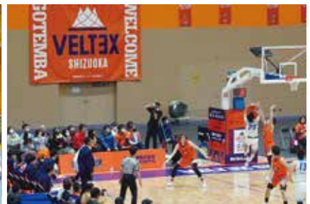
ベルテックス静岡ホームゲーム御殿場開催